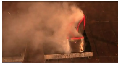
Erste Zelle zündet