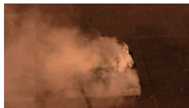
Erste Zelle zündet