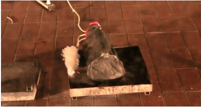
Erste Zelle zündet