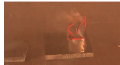
Starke Rauchentwicklung mit Einschränkung der Sicht.

Link zum Video: https://youtu.be/LWQafk3llcg