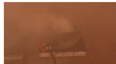
Starke Rauchentwicklung mit Einschränkung der Sicht auf < 5\text{m} .

Link zum Video: https://youtu.be/JAMhlf4ODK0